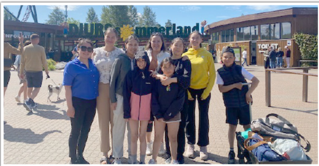
Meeqqat Allu-mit aasakkut feeriartut

Aamma annertuumik ANT-fondenip tunissuteqarneratigut meeqqat inuusuttuaqqallu 2023-imi aasakkut feeriarnissaat qulakkeerneqassaaq.