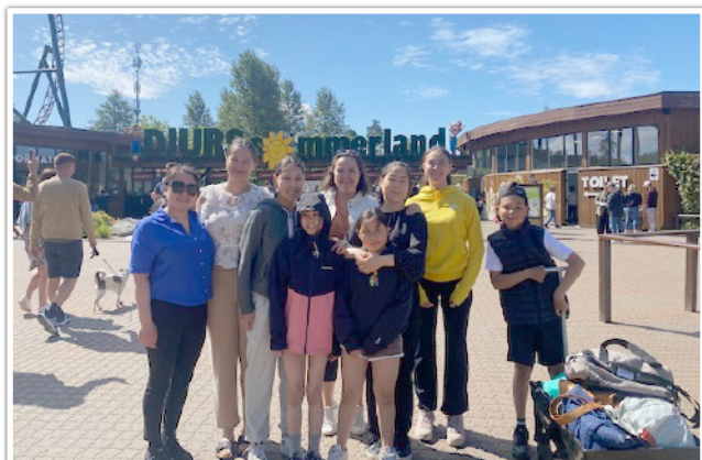
Børnene fra Allu på sommerferie

Endnu en stor donation fra ANT-fonden vil sikre de anbragte børn og unges sommerferie i 2023.