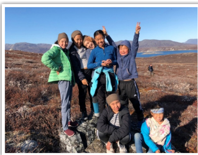
Glade børn i Kapisillit

Vejret var skønt og børnene havde nogle dejlige og afslappende ture.