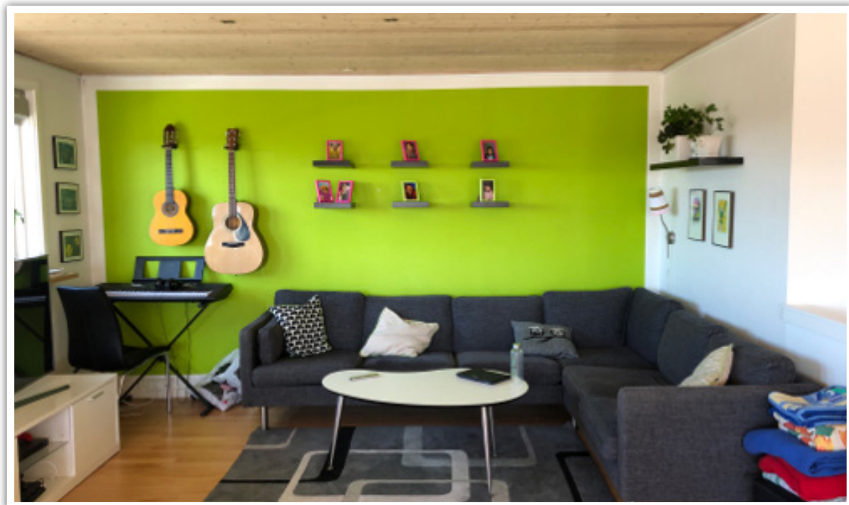
Stuen i Ilasiaq, hvor der bruges mange timer på hygge og socialt samvær.

Selve huset er som et almindeligt familiehus. Det er gennem årene er blevet renoveret, så det i dag fungerer optimalt, både i forhold til de børn og unge der bor i huset, samt for personalet. Da det er et helt almindeligt familiehus børnene bor i, betragter de det som deres hjem fremfor at de tænker "vi er insti-