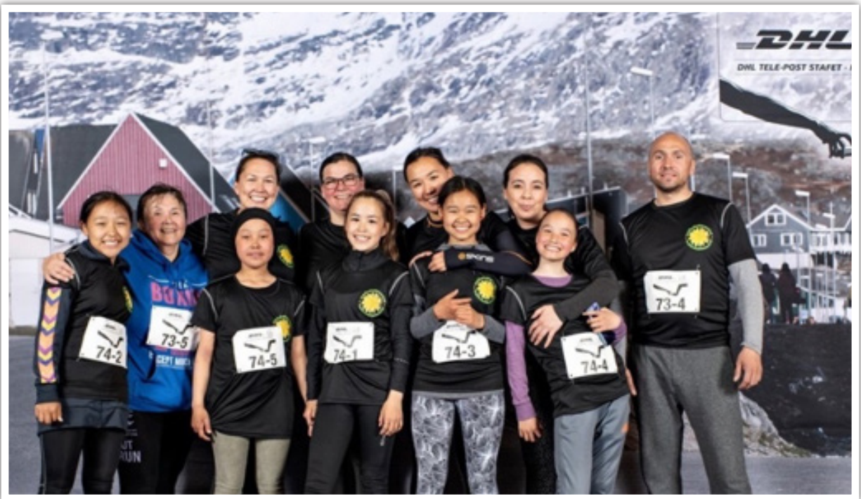
Et talstærkt hold fra Mælkebøttecentret til DHL 2019

Til Brugseni løbet deltager børnene også flittigt hvert år.