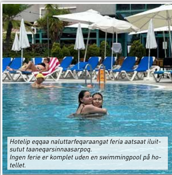
Hotellip eqqaa naluttarfeqaraangat feria aatsaat iluitsutut taaneqarsinnaasarpoq. Ingen ferie er komplet uden en swimmingpool på hotellet.

Tenerifemut feriarnissaq sivi-suumik qilanaarineqarsimasooq qaangiuppoq, ilumullu tassani misigisarpassuupput! Meeqqat sulisullu tamarmik aallarnissartik qilanaarisimavaat, naatsorsuutigisallu naapertorlugit seqinersuup ataani eqqaamasat nuanneqaat sammisallu quianartortaqarlutik. Angalaneq nalissaqanngilaq, angalasullu tamarmik imminnut qanillipput ataatsimullu qeqertaq misigisaqarfigalugu. Ataqatigiinneq annertunerulerpoq ataatsimullu Tenerife alutornaqisumik misissorlutigulu pinngortitaq pinneqisoq aliannaarsaarfigaarput.